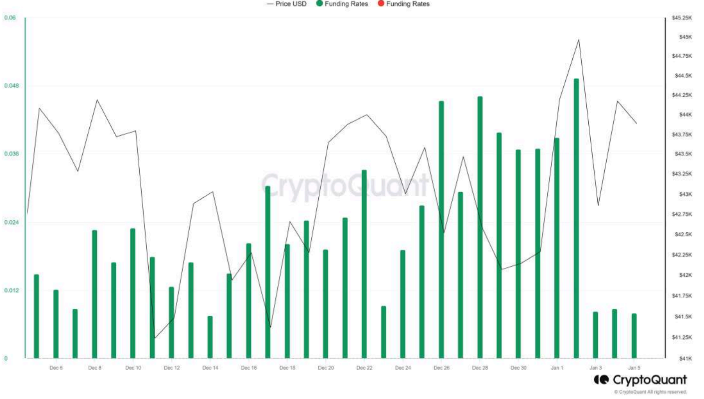
Bitcoin: Funding Rates - All Exchanges

Bitcoin fonlama oranını incelediğimiz Aralık boyunca pozitif devam ettiğini ve yeni yılda da pozitif bir şekilde ilerlediğini görüyoruz. Pozitif fonlama oranları, uzun pozisyon taşıyan traderların daha baskın olduğunu ve kısa pozisyon taşıyan traderlara ödemeye yapmaya istekli olduklarını göstermektedir. Bu yorumlama ile Bitcoin özelinde “long” yönlü işlem yapanların daha ağırlıkta olduğundan bahsedebiliriz.