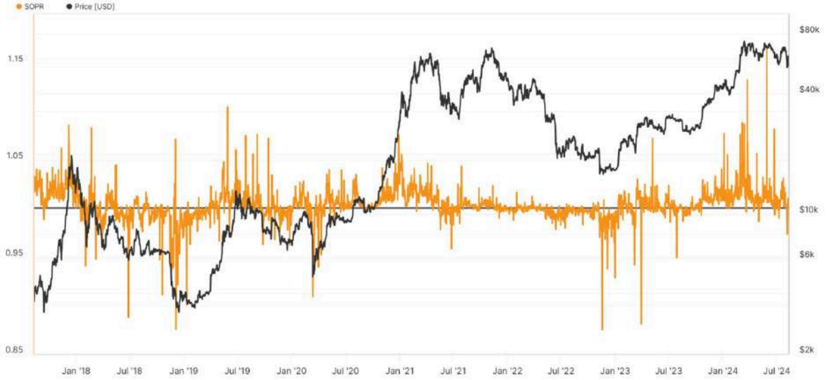
BTC: Spent Output Profit Ratio (SOPR)