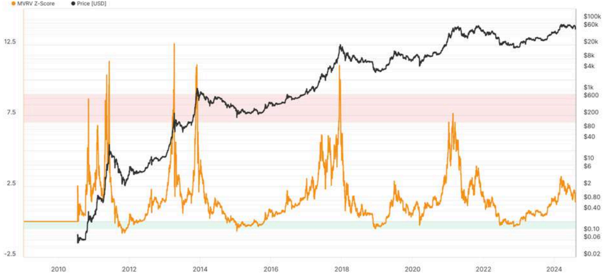
BTC: MVRV Z-Score